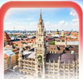
จัตุรัสมาเรียนพลัทซ์